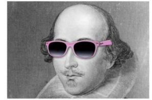
ELIZABETHAN SECURITY STAFF

Collaboration avec la gendarmerie de Beaulieu sur Dordogne pour organiser le déplacement des élèves, des parents et des spectateurs entre la salle Sévigné et le collège. (Encadrement par des élèves responsables de la circulation : Gilets jaunes estampillés « Elizabethan Security Staff »)