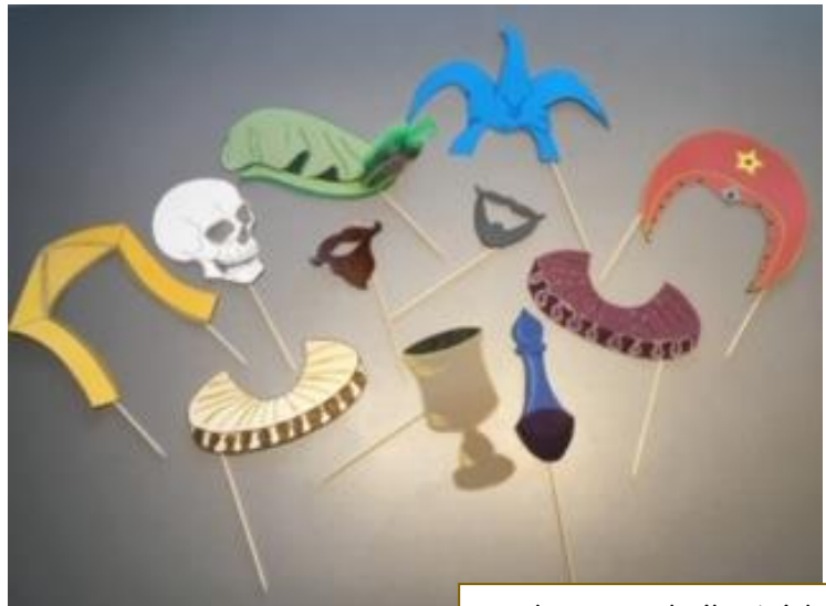
Photo Booth élisabéthain