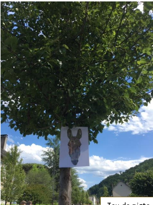
Jeu de piste. Exemple d'indice à trouver dans la ville.