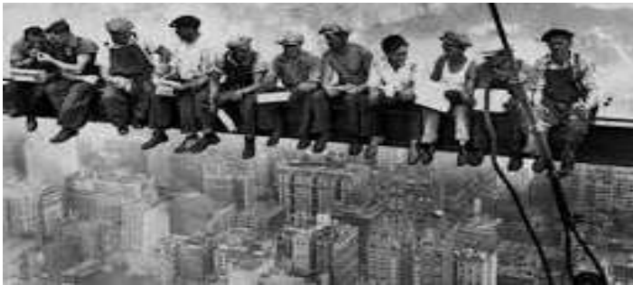
«Lunch atop a skyscraper» 1930