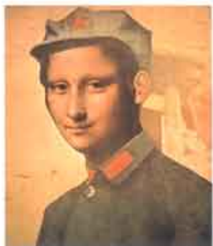
roman cieslewicz PHOTOMONTAGES

Les artistes avant-gardistes ont été les premiers à imaginer le collage comme procédé de fabrication des images (Braque et Picasso) puis à introduire la photographie dans l'affiche (John Heartfield), bref à inventer le photomontage et le collage.