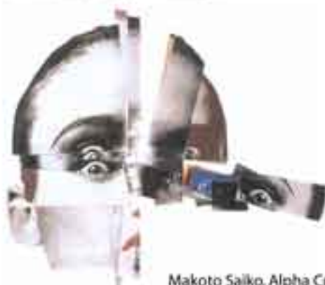
Makoto Saiko, Alpha Cubic, 1987

En vous inspirant librement des exemples qui sont présentés ci-dessus. Il vous est demandé de sélectionner des images dans des magazines afin de créer un photomontage sur le thème de «la journée sans portable». Techniques : découpage et collage. Durée 2 heures.