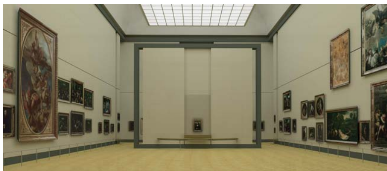
Image virtuelle en 3 dimensions, la nouvelle salle des États après rénovation