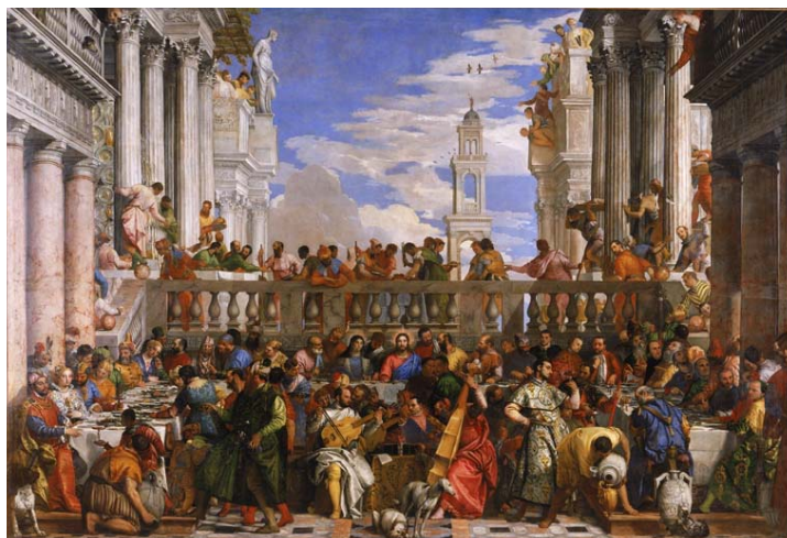
Paolo Caliari, dit Véronèse (1528-1588), Les Noces de Cana, musée du Louvre

Une cinquantaine d'oeuvres vénitiennes du XVI e siècle sont également présentées dans la salle des États rénovée. "Siècle d'or" culturel de la République, le XVI e est la période la plus brillante de l'histoire de Venise, au cours de laquelle l'école de peinture atteint son apogée. Le style vénitien est une synthèse unique, harmonieuse fusion d'influences du sud et du nord, marquée par l'amour des Vénitiens pour la couleur, hérité de Byzance. Giorgione est le grand initiateur de la peinture moderne vénitienne, imposant un naturalisme intimiste. Titien, son collaborateur le plus proche, lui succède comme peintre principal. Il crée jusqu'en 1515 une suite de chefs-d'oeuvre qui fonde le classicisme lagunaire, dit "classicisme chromatique". Certaines de ces oeuvres seront visibles dans la salle des États, entre autres Le Concert champêtre , la Mise au Tombeau , la Jeune fille au miroir , L'Homme au Gant , Les Pèlerins d'Emmaüs ...Après 1540, Venise connaît une évolution vers le maniérisme, sans que soit jamais remis en cause le goût du naturel cher aux Vénitiens. La postérité de Titien est immense et inspire notamment Bassano, dont on peut admirer la Déposition du Christ , Deux chiens de chasse liés à une souche ..., Tintoret ( Suzanne au bain , l'esquisse pour le Paradis , ...) et bien sûr Véronèse ( Jupiter foudroyant les vices , la Belle Nani ...) pour ne citer que quelques oeuvres.