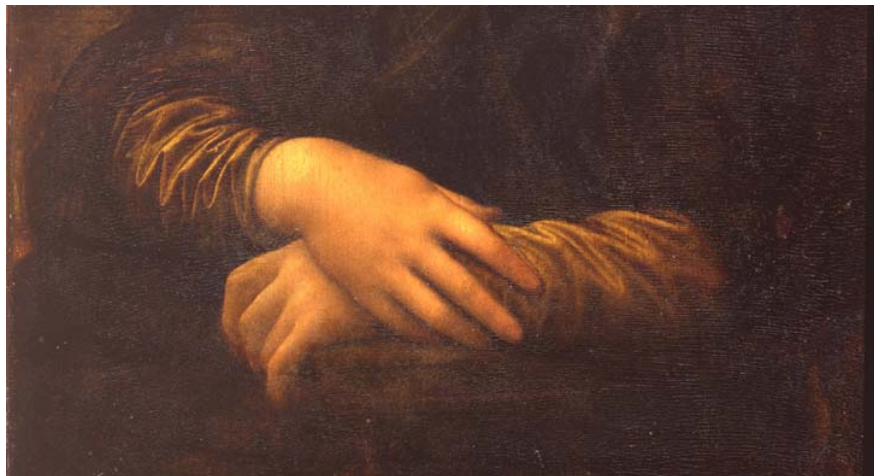
Léonard de Vinci (1452-1519), portrait de Lisa Gherardini, épouse de Francesco del Giocondo, dit Monna Lisa ou La Joconde, détail, bois (peuplier), musée du Louvre

Léonard de Vinci commence à peindre La Joconde vraisemblablement à Florence en 1503 sur un mince panneau de peuplier blanc (d'une hauteur de 0,77 m et d'une largeur de 0,55 m). L'oeuvre est emportée par le peintre à Milan en 1506. Elle le suit en France, où Léonard est invité par François I er en 1517, après la disparition de son protecteur, Giuliano de Medici. C'est vraisemblablement en 1518 que le roi François I er acquiert pour une forte somme, auprès de l'un des deux élèves dont l'artiste avait déjà fait ses héritiers, La Joconde ainsi que d'autres peintures de Léonard. Propriété royale, elle décore les différentes résidences des souverains. Après Fontainebleau, elle est signalée au palais du Louvre en 1650, puis à la fin du XVII e et au XVIII e siècles au château royal de Versailles, où elle ne semble pas faire l'objet d'un intérêt particulier. En 1793, le « Museum central des Arts » est créé au Louvre. La Joconde y est transportée en 1798. En 1800, Napoléon I er l'installe avec quelques autres portraits dans ses appartements des Tuileries. C'est à partir de 1804 qu'elle prend place définitivement dans les salles du musée.