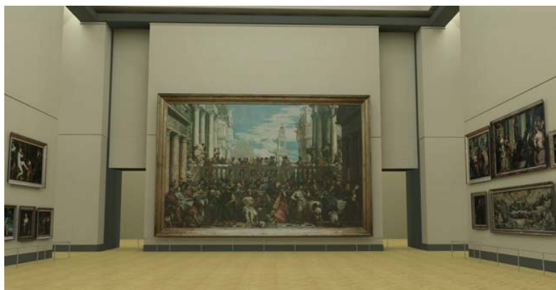
Image virtuelle en 3 dimensions, la nouvelle salle des États après rénovation (coté Grande Galerie )

Fermée le 4 avril 2001 pour travaux , la salle des États ne permettait plus d'admirer correctement les œuvres: mauvais éclairage, absence de climatisation, circulation difficile du fait de l'augmentation du public... Son état datait de 1950.