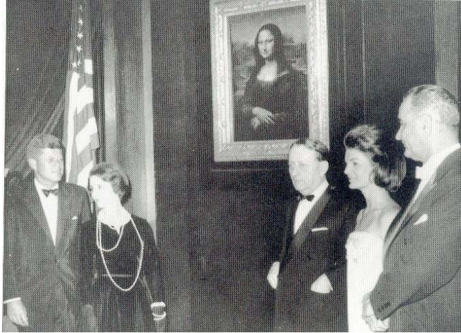
Présentation de La Joconde à la National Gallery de Washington, en présence de John et Jacqueline Kennedy, André et Madeleine Malraux, le 8 janvier 1963.

C'est dans une cabine de première classe du paquebot « France » que La Joconde partit aux Etats-Unis en décembre 1962. André Malraux, ministre des Affaires culturelles, avait insisté pour que l'œuvre soit présentée aux Américains, notamment en hommage aux soldats tombés en Normandie en juin 1944 (et sans doute par amitié pour Jacqueline Kennedy). Il fut soutenu par le président de Gaulle dans cette démarche.