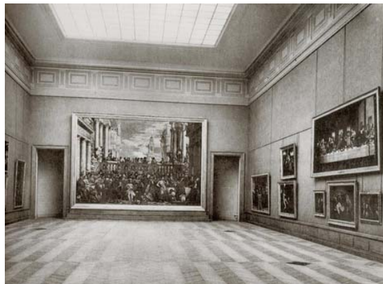
La salle des États, vers 1950, musée du Louvre

Les décors furent alors impitoyablement supprimés. Le décor des voussures fut détruit. Les proportions de la salle furent modifiées et réduites : une cloison fut mise en place pour Les Noces de Cana de Véronèse, créant un vestibule entre cette salle et le Pavillon Denon. La Joconde y prit place en 1966 et ne la quitta pas jusqu'en 2001 (date de fermeture de la salle pour travaux), à l'exception de trois petites années, entre 1992 et 1995, où elle fut présentée dans la Grande Galerie.