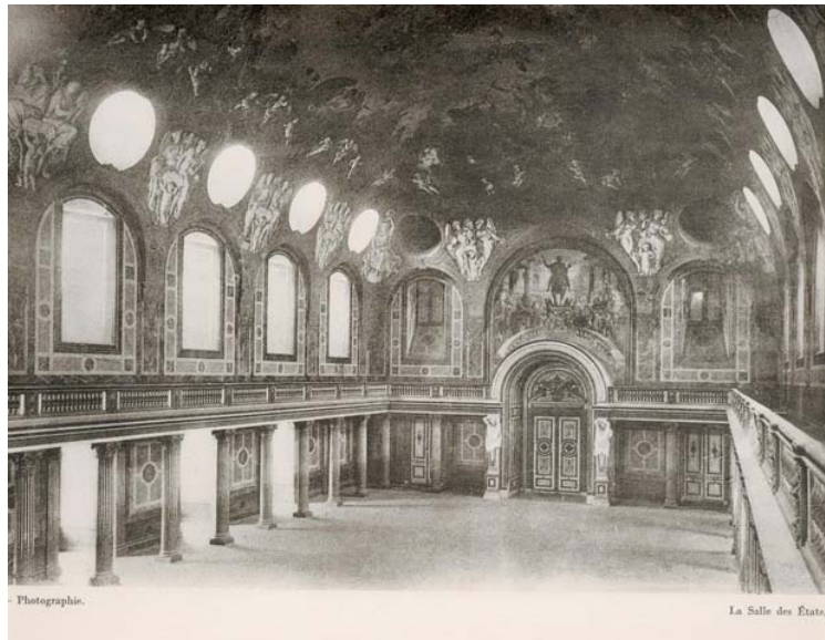
Hector Lefuel, la salle des Etats, 1857, musée du Louvre

La III e République naissante n'avait que faire d'une Salle des États. Elle fut donc mise à la disposition du musée, qui l'occupait déjà entre les séances.