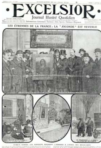
Les « Une » du journal L'Excelsior lors du vol puis du retour de La Joconde .

Le 21 août 1911, La Joconde est volée de manière spectaculaire. Le grand public suivra ce roman policier au jour le jour, les recherches policières ne négligeant aucune piste.