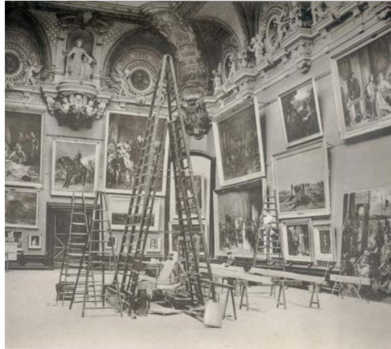
La salle des peintures françaises du XIX e siècle, 1886, musée du Louvre

Sous la direction de l'architecte Edmond Guillaume, successeur de Lefuel, les fenêtres furent cachées par une cimaise et le plafond remplacé par une verrière. Le nouveau décor des parties hautes fut constitué de stucs dont les figures de La France ancienne , par Thomas, et de La France moderne protégeant les Arts par Hiolle. Des génies et des médaillons représentant les artistes français formaient une haute corniche.