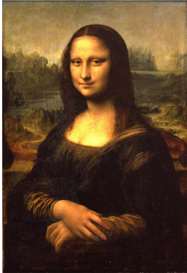
Léonard de Vinci (1452-1519), portrait de Lisa Gherardini, épouse de Francesco del Giocondo, dit Monna Lisa ou La Joconde, bois (peuplier), musée du Louvre