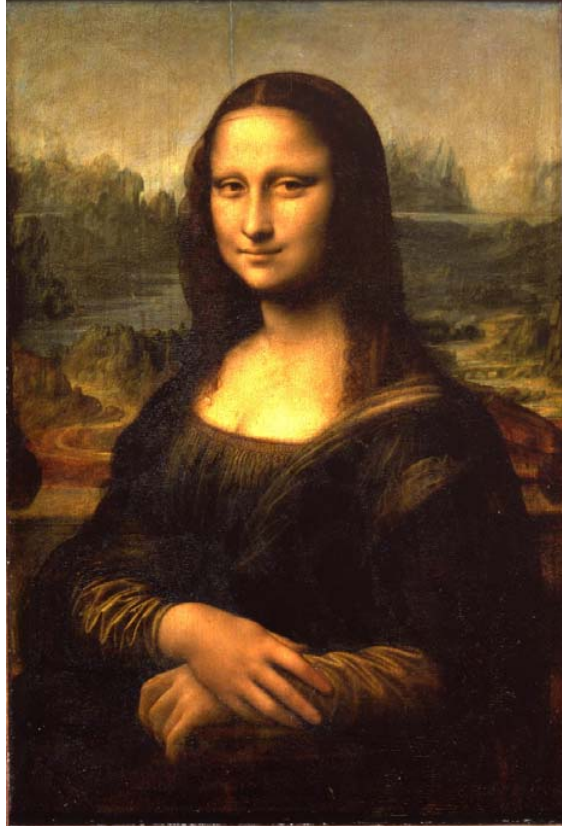
Léonard de Vinci (1452-1519), portrait de Lisa Gherardini, épouse de Francesco del Giocondo, dit Monna Lisa ou La Joconde, détail, bois (peuplier), musée du Louvre

Cependant il existe aussi dans ce sourire une nuance indéfinissable, quelque chose comme une pointe d'ironie qui vient d'ailleurs plus du regard que de la bouche, et tempère son abstraction idéale en la rattachant au monde terrestre. Est ainsi atténuée une ambiguïté certaine entre l'expression quasi divine et l'impression première et définitive qui est celle d'un portrait.