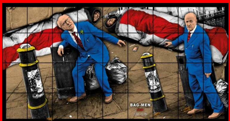
BAG-MEN, 2020, 302 x 571 cm

https://whitecube.com/exhibitions/exhibition/gilbert_and_george_masons_yard_2021