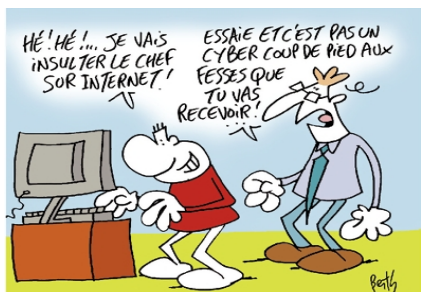
Extrait de Mon quotidien , Édition spéciale réalisée avec la CNIL