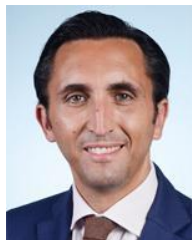
Julien Aubert Les Républicains Président