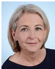
Laure de La Raudière UDI, Agir et Indépendants Rapporteuse