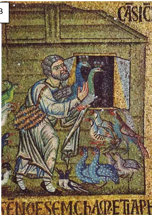
Mosaïque de la Basilique Saint-Marc, Venise (Détails)