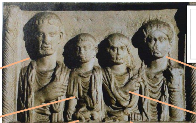
Stèle funéraire de Titus Fuficius, officier de la légion XX, représenté avec sa famille, début du 1 er siècle après J.-C., Split (Croatie), Musée archéologique.

Légende l'image avec les mots suivants : pater, mater, filius, filia, columba, canis.