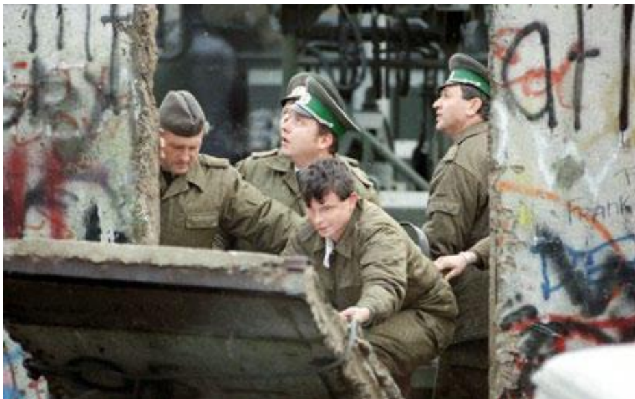
Soldats est-allemands abattant le mur de Berlin. Editions Foucher 2011