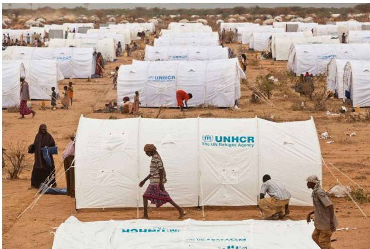
Un camp de réfugiés à Dadaab, au Kenya.

Le Haut Commissariat des Nations Unies pour les Réfugiés est un organe de l'Assemblée Générale de l'O.N.U., qui en a décidé la création en 1949. Ses activités ont débuté le 1 er janvier 1951.