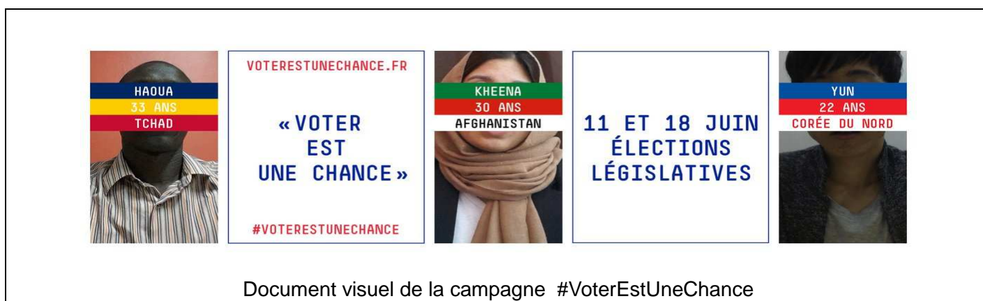
Document visuel de la campagne #VoterEstUneChance

Document : « Voter est une chance », extrait d'une campagne de sensibilisation menée en juin 2017 durant les élections législatives françaises.