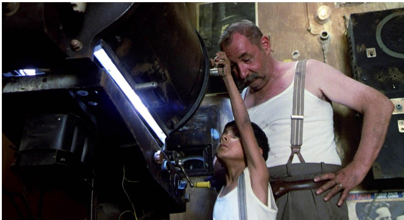
Photogramme du film Cinéma Paradiso (1988)

Tous les jours, le petit Salvatore, dit Toto, vient dans la cabine de projection du cinéma d'Alfredo au début du XXe siècle.