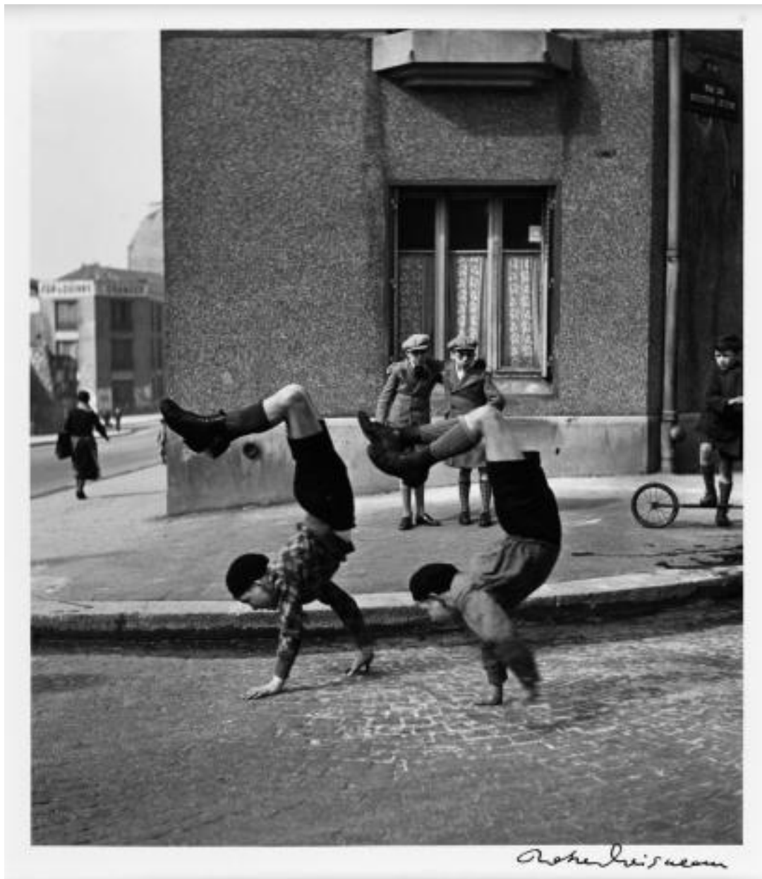
Robert Doisneau, Les frères , rue du Docteur Lecène, 1934.