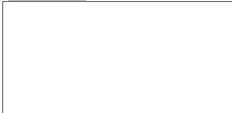
Schéma du circuit :