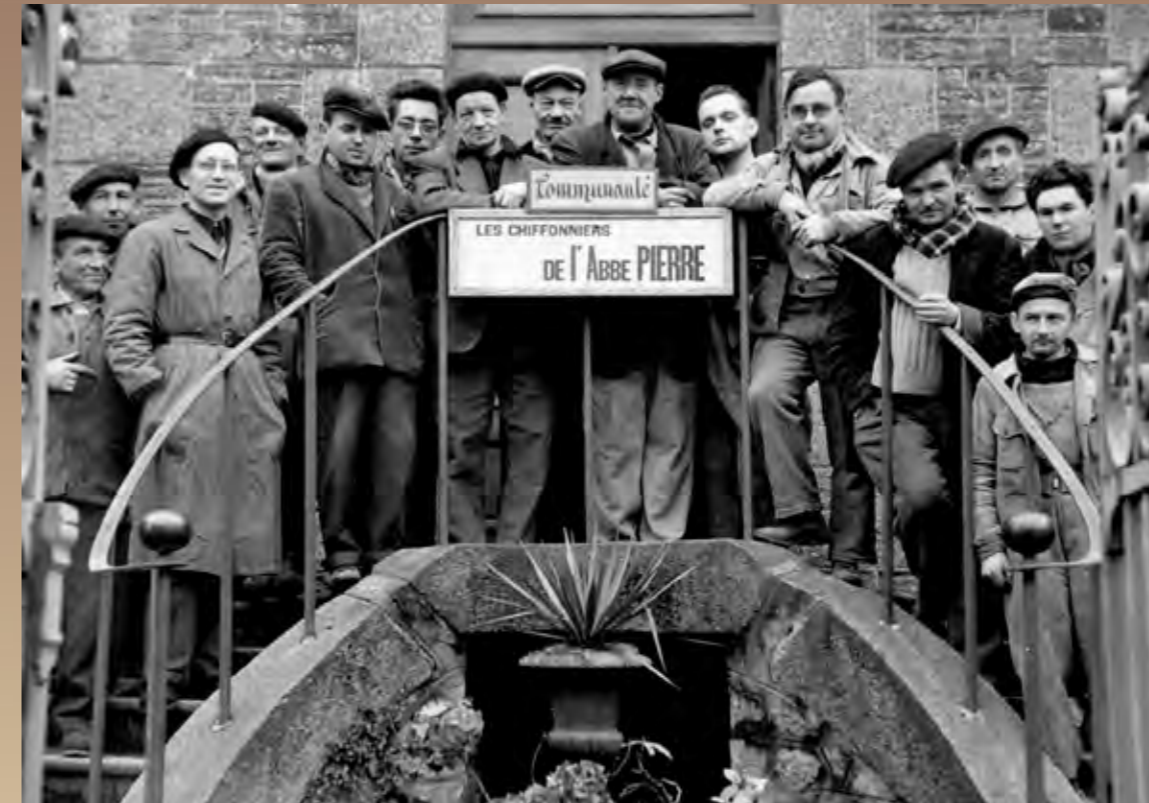
Les compagnons d'Emmaüs à Brest en 1957 (Crédit photo : Emmaüs International)

TEXTE / Le rapport 2023 sur l'état du mal logement (les rapports précédents sont également disponibles) : https://www.fondation-abbe-pierre.fr/actualites/28e-rapport-sur-letat-du-mal-logement-en-france-2023