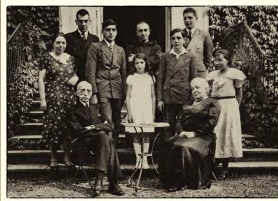
L'abbé Pierre en famille

Grouès entre au couvent des Capucins de Crest (Drôme), ordre des franciscains qui a fait vœu de pauvreté. Après avoir été « Castor méditatif » chez les scouts, Grouès devient « Frère La Joie ». Il est ordonné prêtre en 1938.