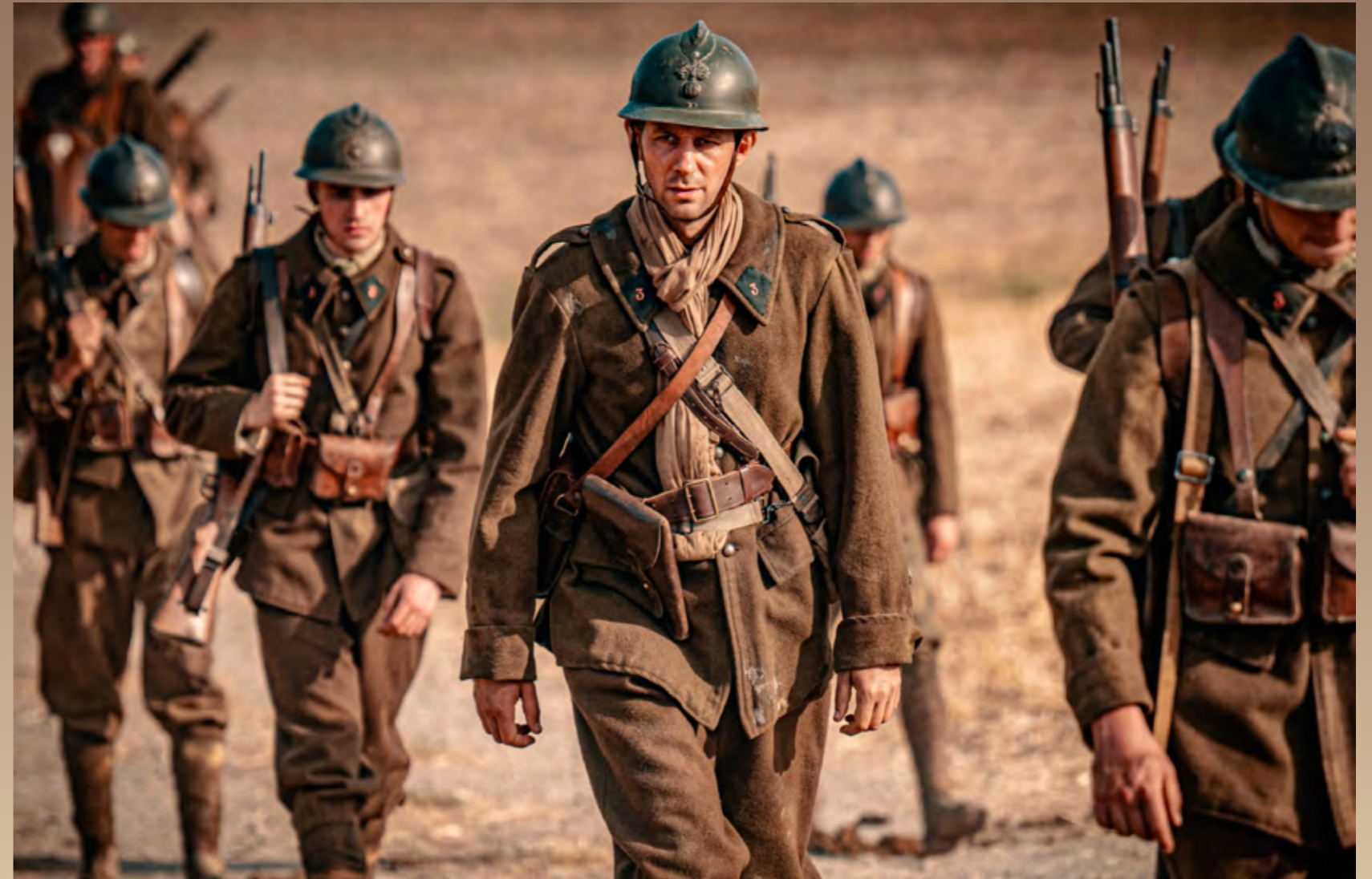
Henri Grouès soldat, dans le film

Dans ces conditions, rejoindre la résistance est pour un catholique, et plus encore pour un ecclésiastique comme l'abbé Pierre, un geste de désobéissance en même temps qu'une réelle remise en question des valeurs portées par l'institution. Ce geste est accompli par les démocrates chrétiens et les syndicalistes chrétiens qui se trouvent dans la France Libre dès 1940-41, le plus souvent par refus de la défaite, et dont une partie d'entre eux (Teitgen, Menthon...) fondent le journal Liberté . De plus, le mouvement de résistance spirituelle au nazisme déploie des efforts par le biais de publications et conférences clandestines pour prouver le caractère inhumain et anti-chrétien du nazisme et de la collaboration.