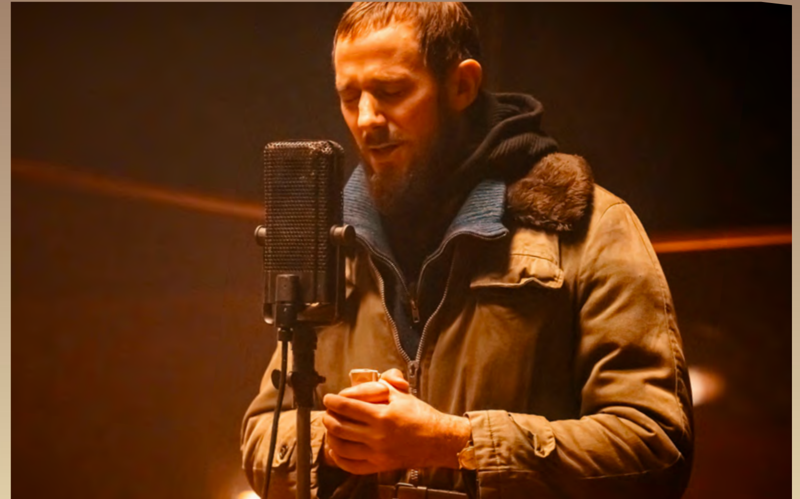
L'abbé Pierre lançant son appel au micro de RTL, dans le film