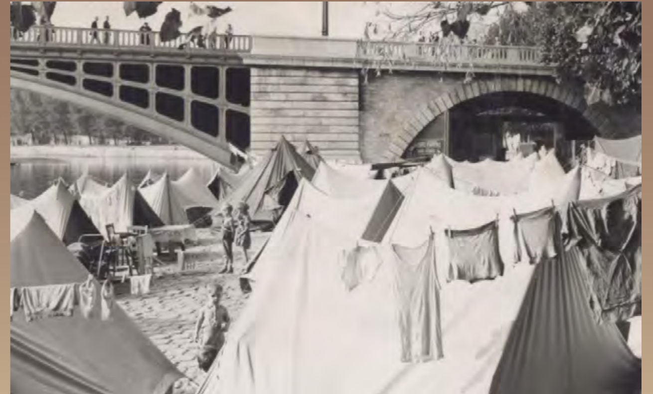
Les arches du Pont de Sully

Chaque année, près de 150 000 assignations pour expulsion sont prononcées, donnant lieu à une moitié de commandements à quitter les lieux, dont 15 000 à 16 000 sont réalisées avec l'intervention de la force publique. Le tiers des familles expulsées ne parviennent pas à retrouver de logement stable, vivant en hôtel, caravane, camping ou chez un tiers. (Source : lacroix.fr, lemonde.fr)