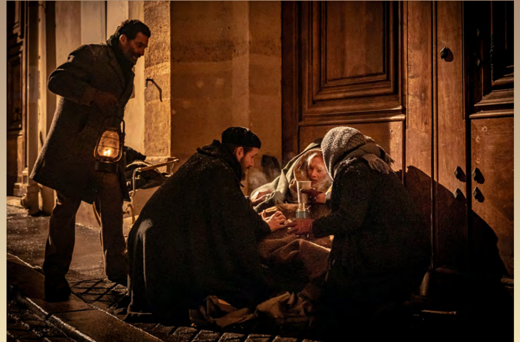
L'abbé Pierre pendant l'hiver 54, dans le film

Je crois qu'il a laissé quelque chose d'essentiel : respecter chacun pour ce qu'il est, laisser à chacune et chacun le droit de faire ses propres choix, d'avancer à son rythme. Il avait une immense foi en l'Homme. Pour lui, l'enjeu n'était pas d'aider en assistant (et en ce sens, il était en avance sur son temps) mais d'aider en permettant aux gens de grandir par eux-mêmes, de se reconstruire et de « se bouger » pour parvenir à le faire. Chacun a sa chance, chacun a sa place, chacun a une valeur.