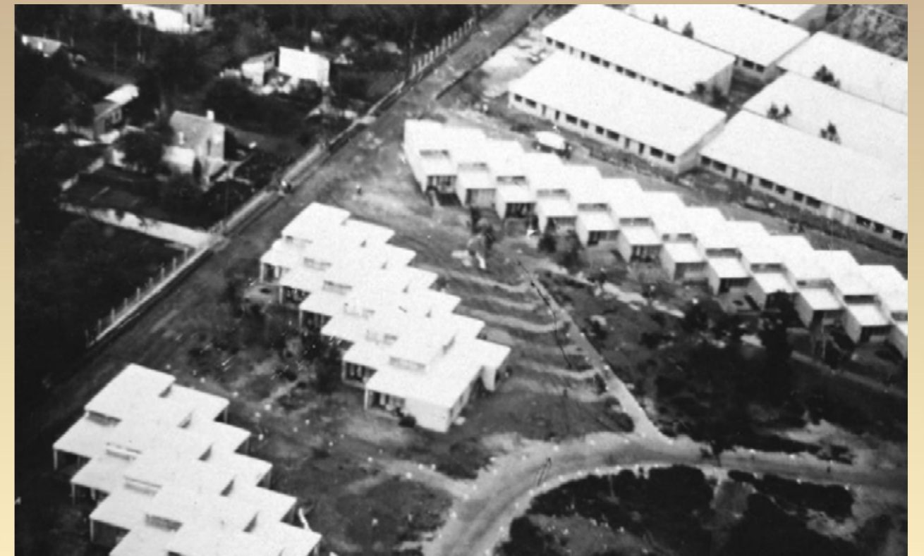
Les premières cités d'urgence