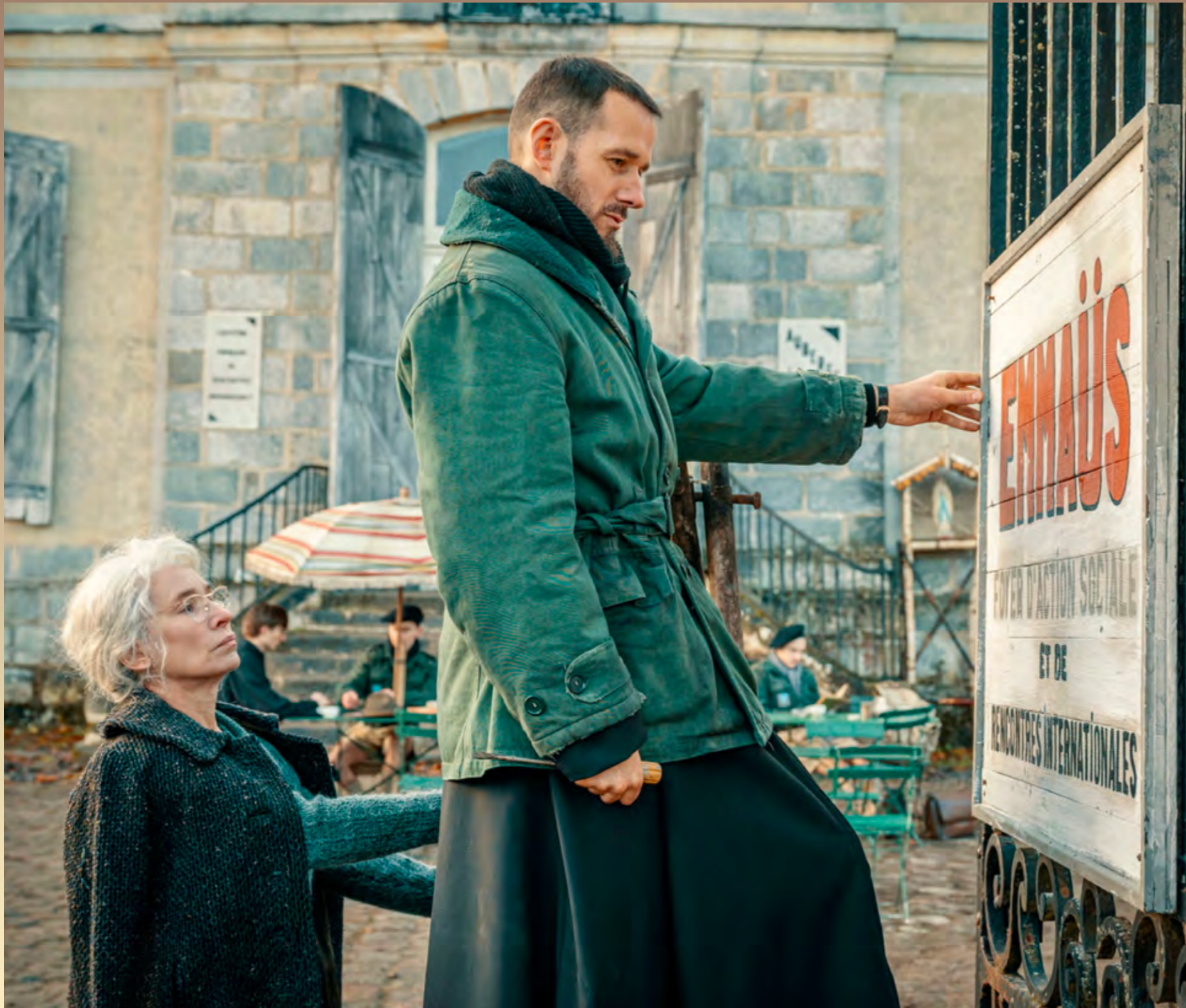
La fondation d'Emmâüs, dans le film