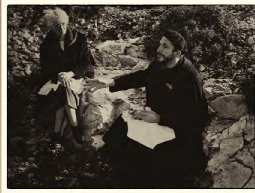
L'abbé Pierre et Lucie Coutaz

L'abbé Pierre lance un appel à l'aide sur la radio nationale (RTF) et sur Radio Luxembourg.