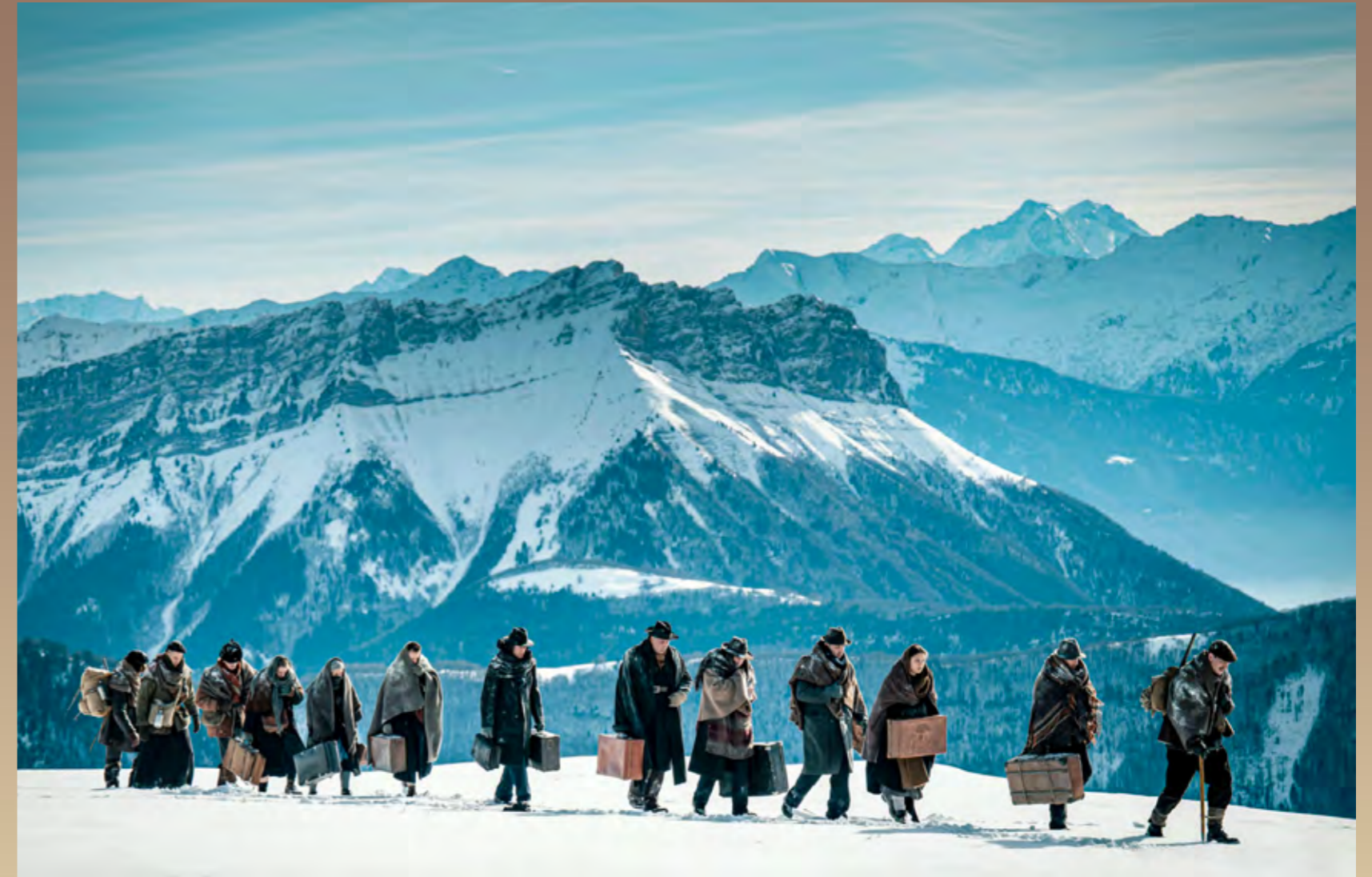
Le passage vers la Suisse, dans le film

Le drame des Glières de mars 1944 n'est que le début des opérations de répression de l'été 1944. Pourtant les maquisards ne baissent pas les bras et, avec les débarquements de Normandie et de Provence, les effectifs repartent à la hausse, jusqu'à atteindre 450,000 hommes, avec des meilleurs équipements parachutés par les alliés, et finalement davantage de succès stratégiques sous la supervision des Forces Françaises de l'Intérieur (FFI). Leur action permet de gêner la progression de la Wehrmacht et des SS.