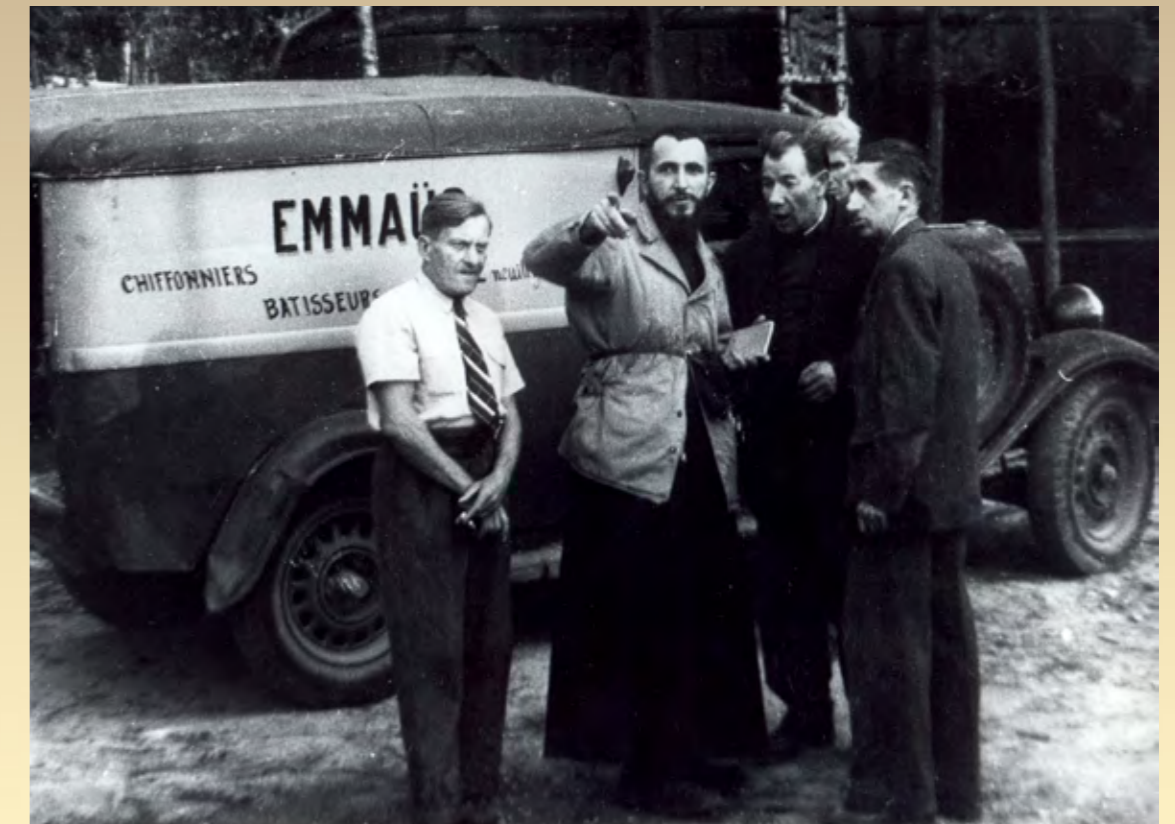
Neuilly-Plaisance, la première communauté d'Emmaüs