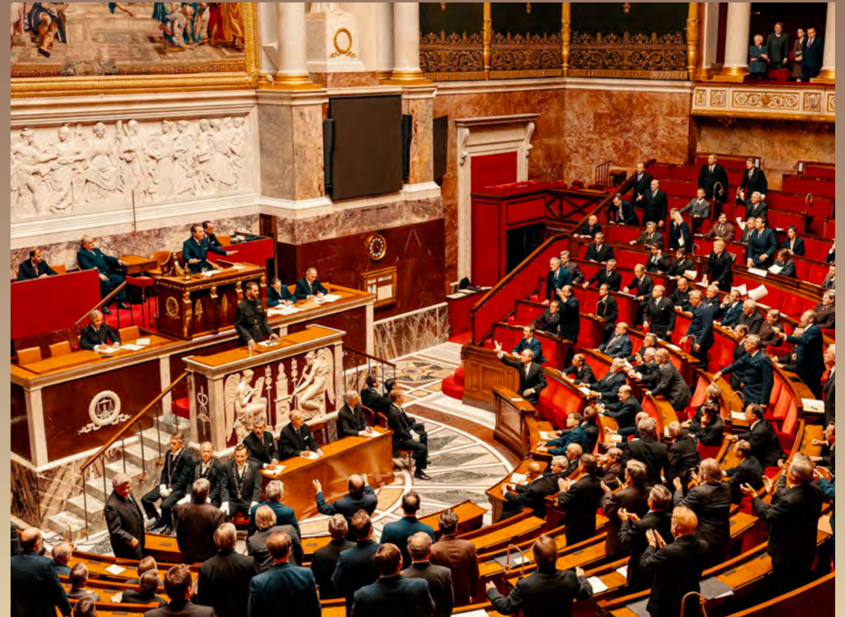
L'abbé Pierre à l'Assemblée Nationale, dans le film

L'intuition de l'abbé, à l'origine des compagnons d'Emmaüs, tient dans l'idée qu'aux désespérés il faut proposer du sens. Le secours peut consister à donner un toit ou des repas, mais il faut surtout leur donner les