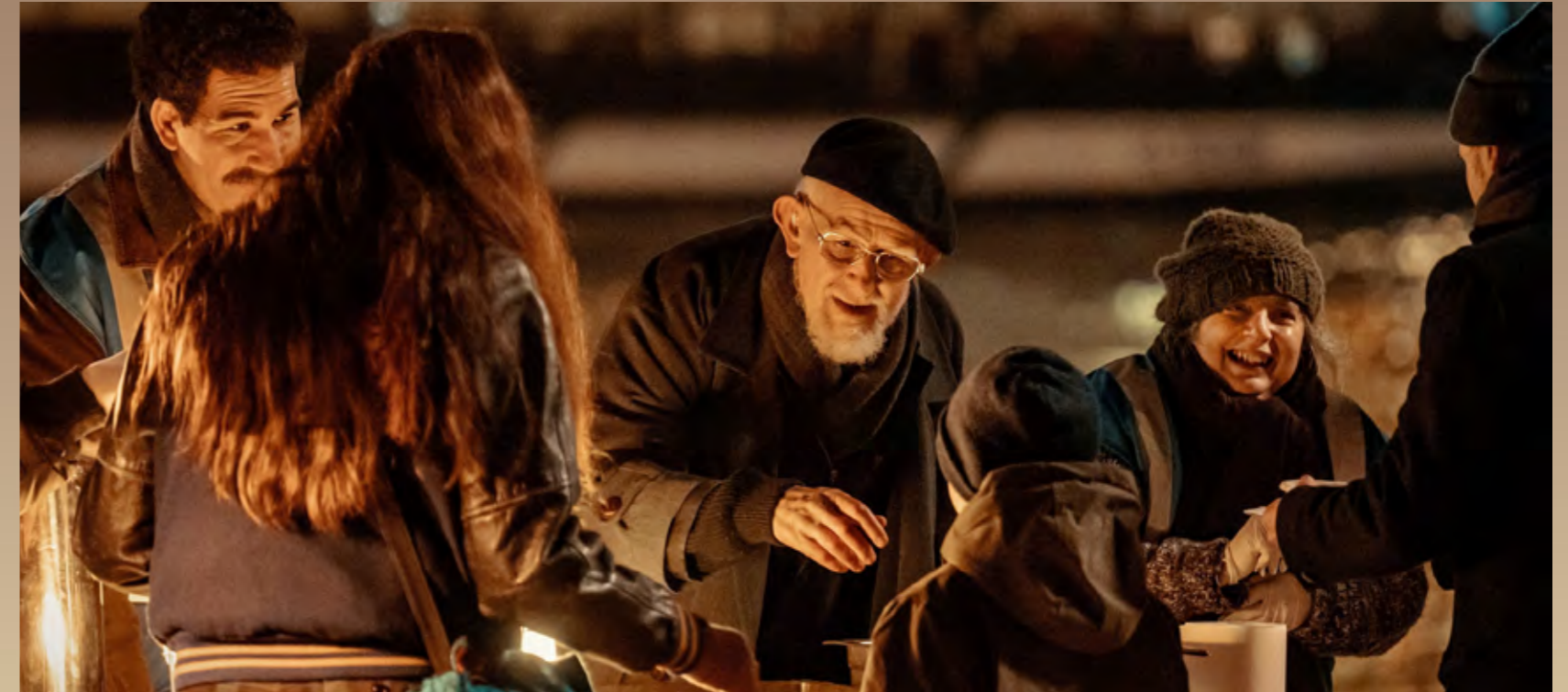
L'abbé Pierre participe à une distribution alimentaire d'Emmaüs, dans le film

Pour aller plus loin, on peut consulter les chiffres de la générosité en France à l'adresse https://www.francegenerosites.org/chiffres-cles/