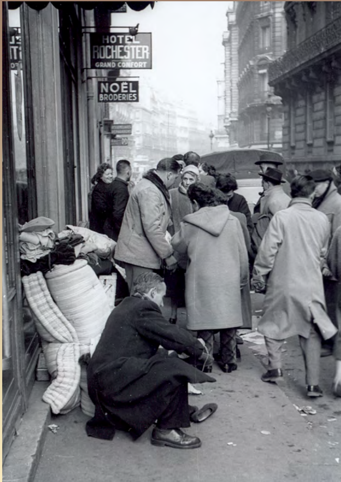
Devant l'hôtel Rochester, hiver 1954