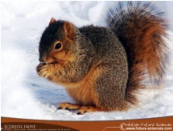
Producteur de matière