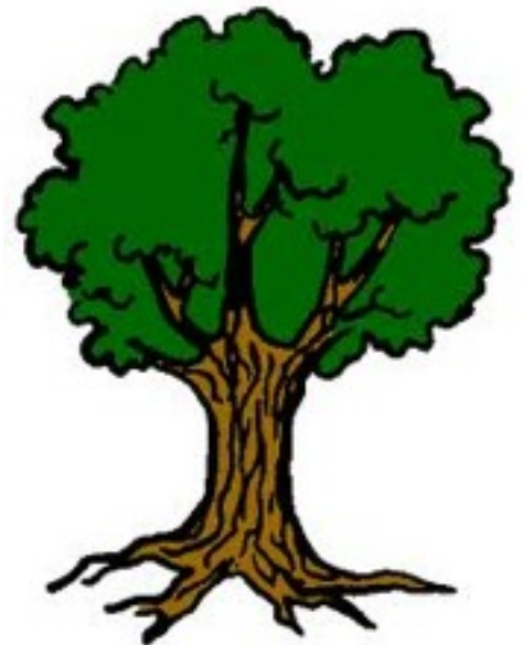
Producteur de matière