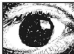
Très gros plan