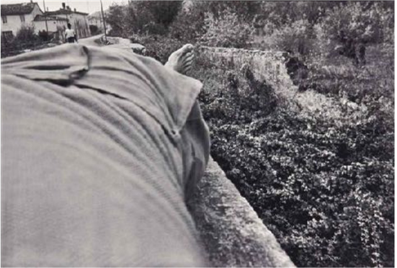
Henri Cartier Besson, 1933