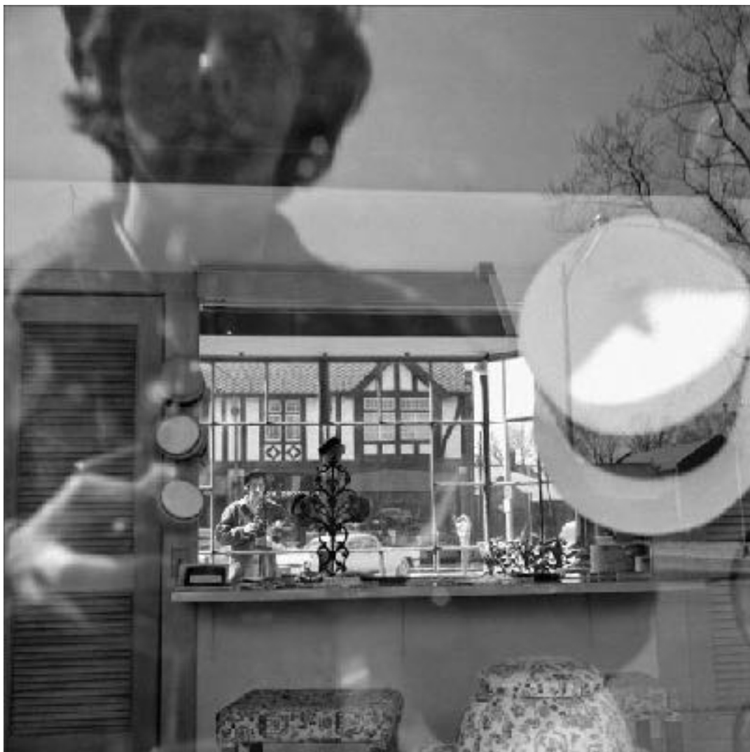
Vivian Maier, 1961