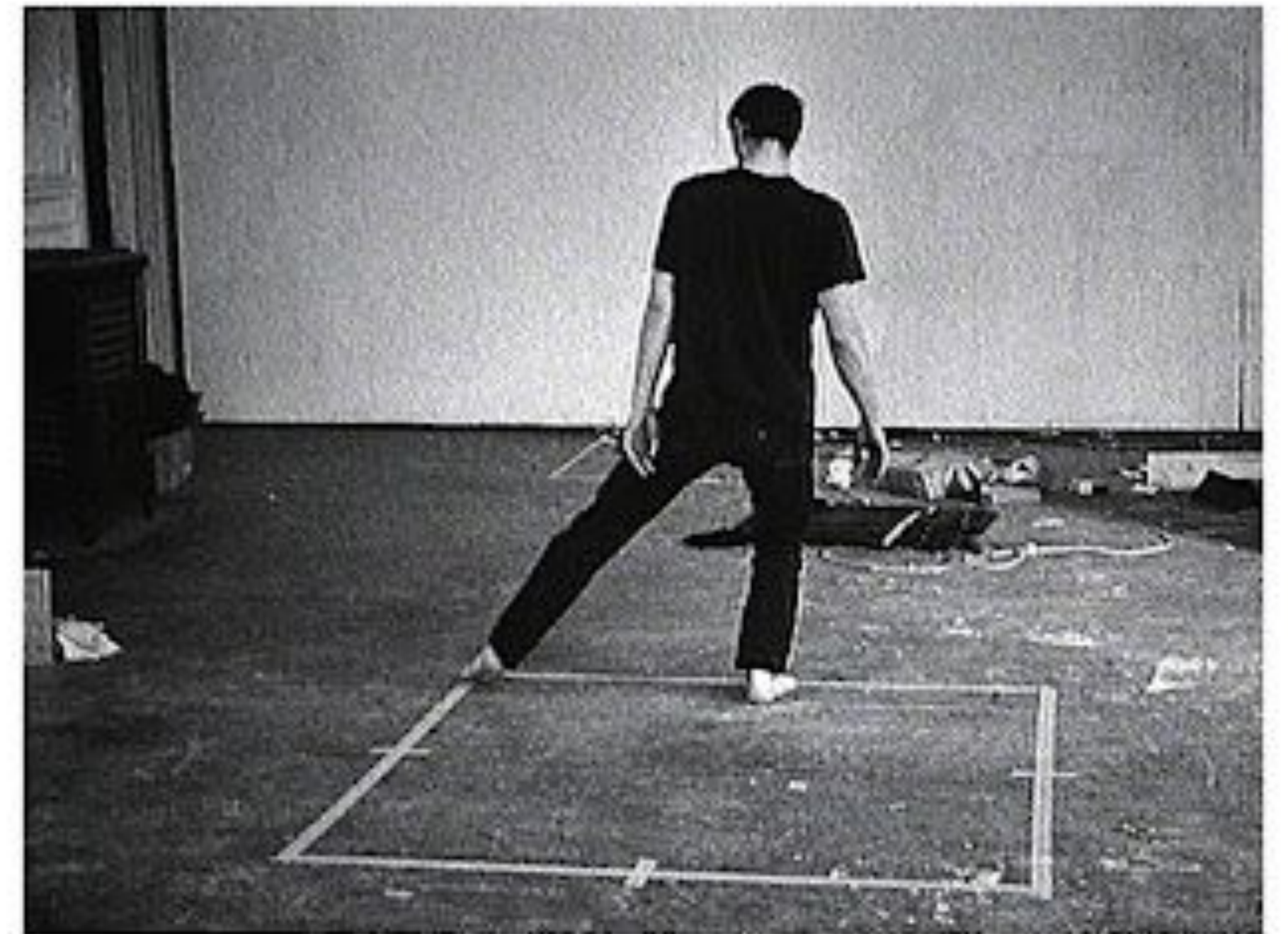
Bruce Nauman Dance or Exercise on the Perimeter of a Square (Square Dance) 1967-1968

https://eduscol.education.fr/729/presentation-du-grand-oral