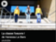
La classe France / de l'espace à l'œuvre

Vidéo projetée dans la salle de la nuit des musées à Rochechouart.