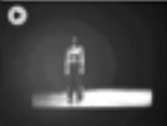
Babette Mangolte, Tête Noire 0012, de l'exposition "L'espace", 2014

Une des œuvres choisies pour le projet "La classe, l'œuvre!"