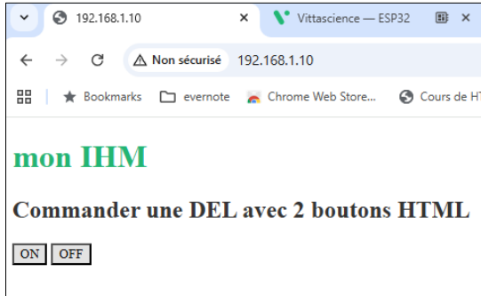
Page IHM dans un navigateur web