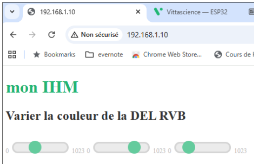
Page IHM dans un navigateur web